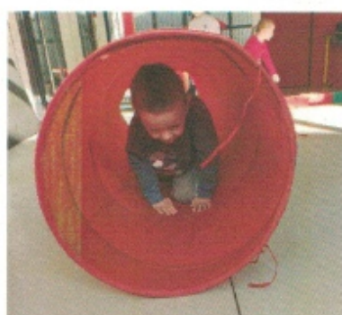
Se déplacer dans le tunnel