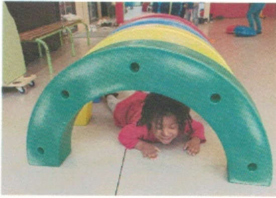
Ramper sous les ponts