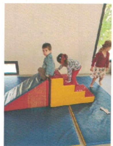
Grimper à l'escalier et glisser sur le plan incliné