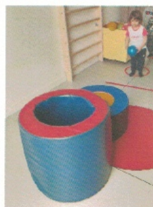
Lancer des ballons dans la roue ou le tonneau