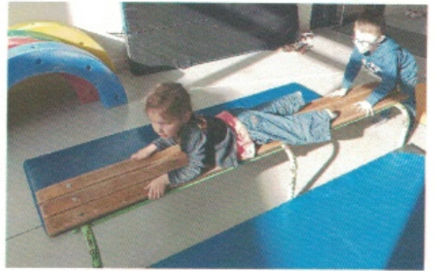
Ramper sur le banc