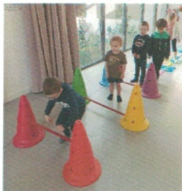
Franchir les petites haies en sautant