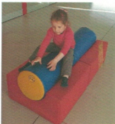
S'équilibrer sur le boudin