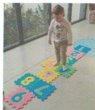
Jouer à la marelle