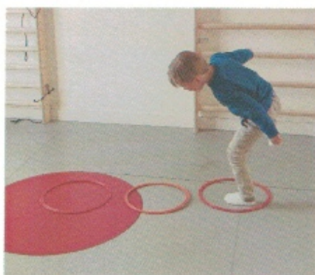
Sauter à cloche pieds ou à pieds joints dans les cerceaux