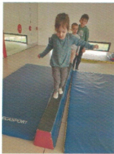
S'équilibrer sur la poutre