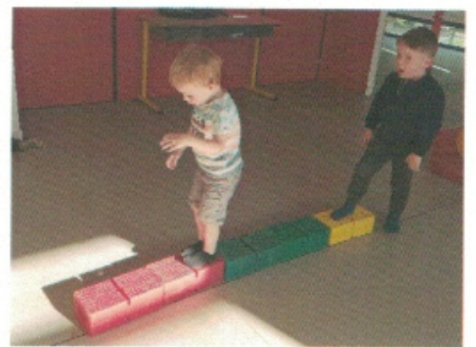
S'équilibrer sur les briques