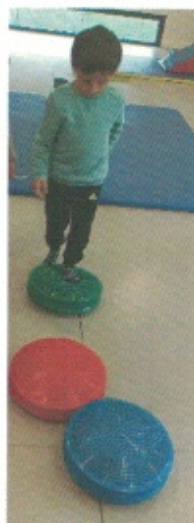
S'équilibrer sur les coussins piquants