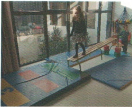
Monter sur la chaise puis s'équilibrer sur le banc incliné