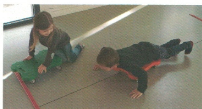
Se déplacer avec les planches à roulettes