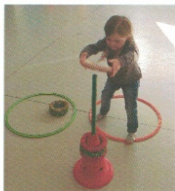
Lancer des anneaux autour des tiges