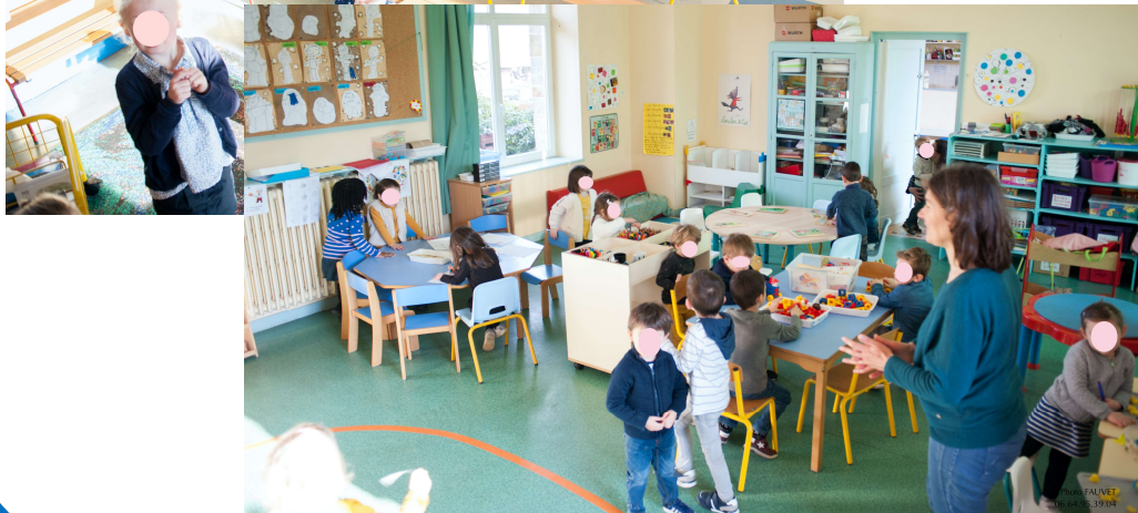
La classe verte